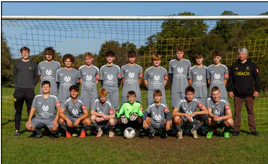
Unsere B-Junioren der JFG Steinachtal im Oktober 2024. Die Heimspiele der A- und B-Jugend werden in Ködnitz ausgetragen.