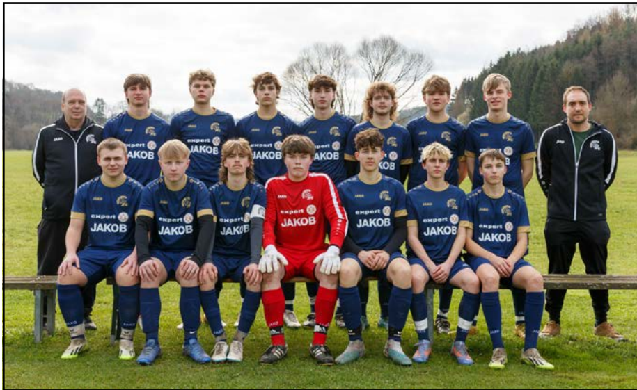
Unsere B-Junioren, die jetzigen A-Junioren, der JFG Steinachtal im März 2024.