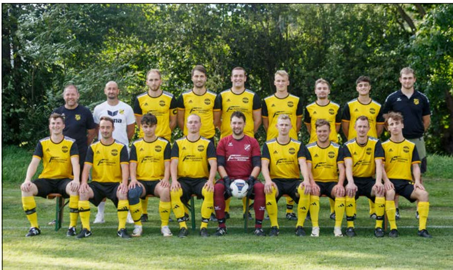
1. Mannschaft des TSV im Juli 2024.